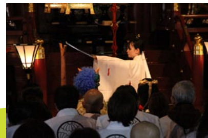
御本殿での「節分祭」 宮司祝詞奏上に続き剣の舞で邪気を祓い「福は内」と豆をまく