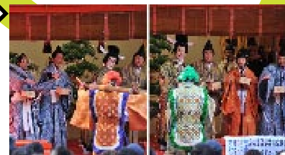
金時の豆打ちをくらって鬼は泣きながら退散！