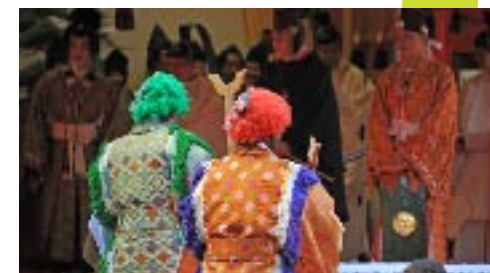
桃弓葦矢で追われ！