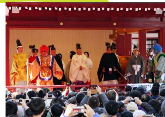
11:30 追儼式（神楽殿） 「やあやあわれこそは…」と、赤鬼・青鬼が登場するが