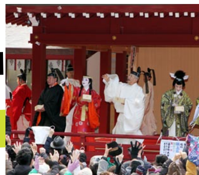
めでたく鬼を退治して「天下泰平・弥栄」を唱え 「福は内！鬼は外！」と賑々しく豆まきが始まる。 （所役に続いて御年役の皆様の豆まきです）