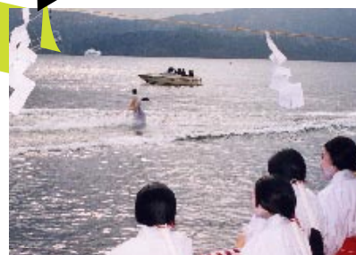
鬼の去った湖水を清め めでたく節分祭を奉修！