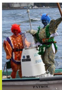
ところがどっこい 鬼はまだ芦ノ湖に！