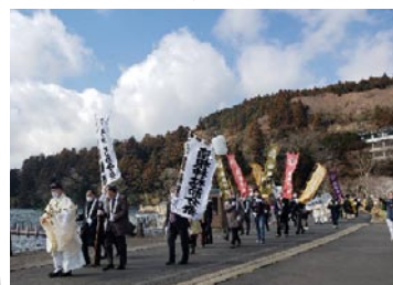
12:15 行列を整え湖上鬼追い へ向かいます。