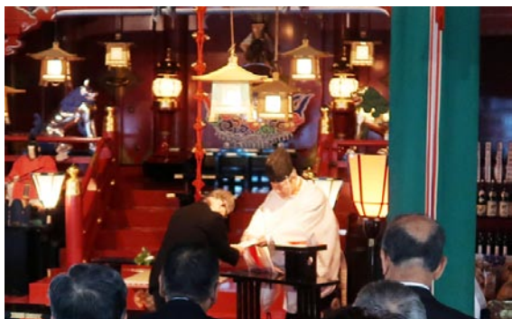
神宮大麻神札頒布祭を斎行

新しい神宮大麻と共に、地域をお守り下さる氏神様、崇敬される神社の御神札を一緒にお祀りして、