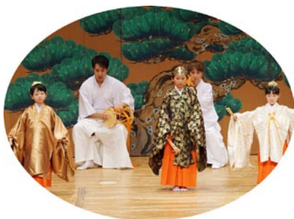
好評を博した箱根三神顕現の舞

さきごろ、横浜市の県立青少年センター紅葉坂ホールにて「かながわこども民族芸能フェスティバル」