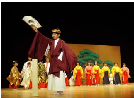
神奈川こども民俗芸能に選ばれた「箱根延年」